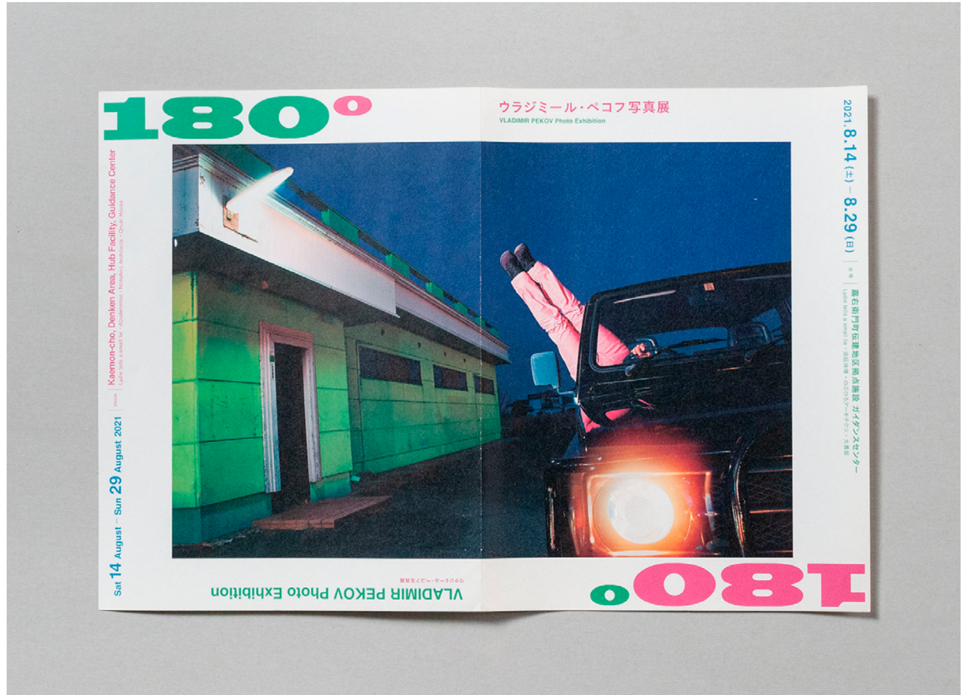
ブルガリア人写真家のウラジミール・ペコフの写真展のためのチラシのデザイン。逆立ちをする日本人を撮影したこの展示に合わせ、天地を入れ替えても成立するような形をとりました。