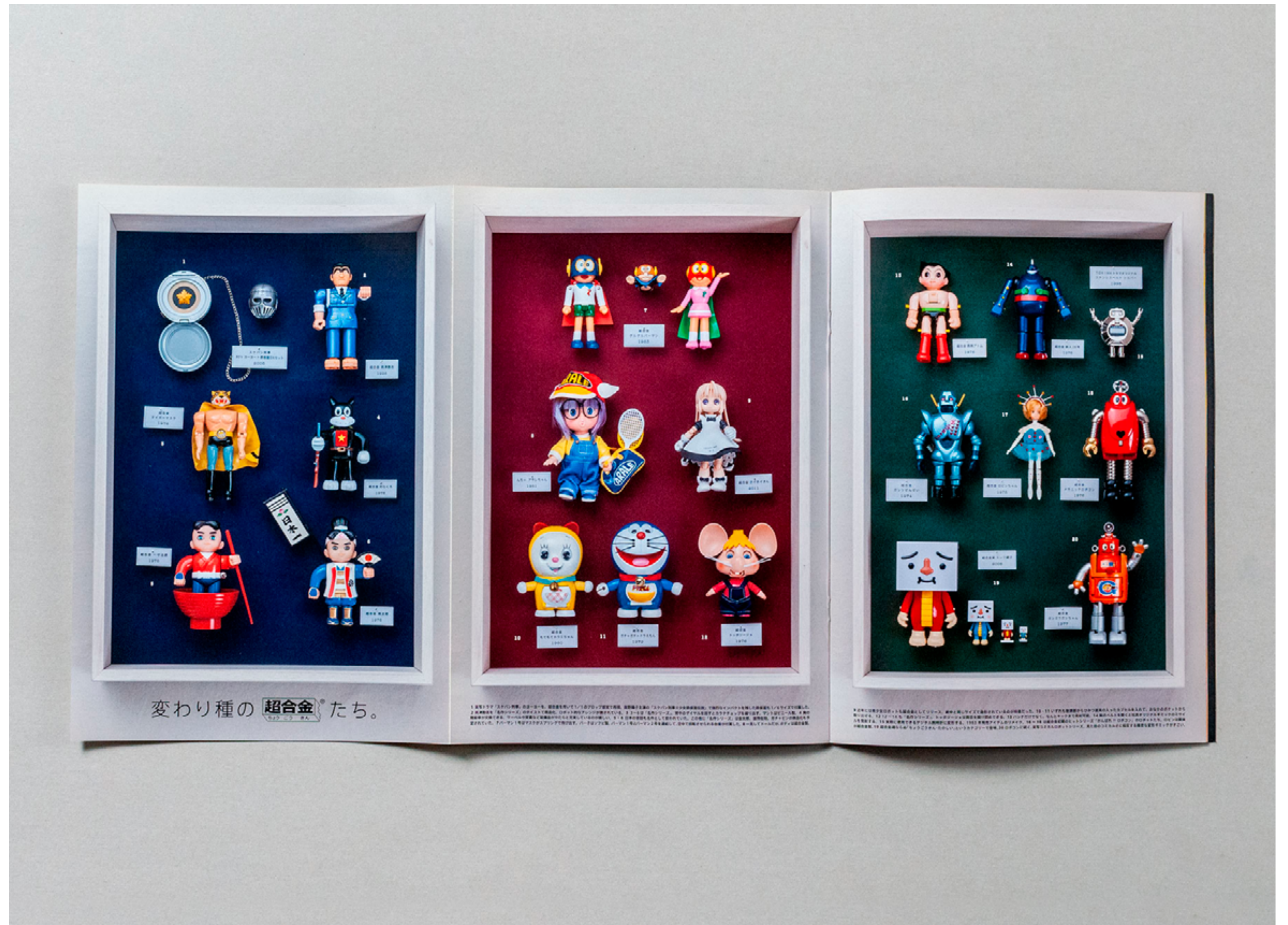
超合金誕生 40 周年を記念したスペシャルムックのデザインを担当させていただきました。歴代の変わり種超合金を甲虫標本のように撮影するディレクションも行いました。